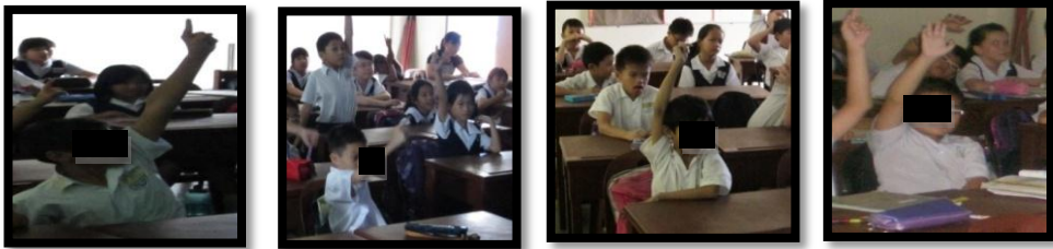
图八：四位研究对象上课时踊跃参与教学活动

图七显示四位研究对象都很专心听课，他们目不转睛地听老师讲课。从他们专心听课的模样看来，可见他们很喜欢老师的课。除此之外，图八也显示四位研究对象踊跃地参与教师所准备的活动，师生互动良好。这两张图表证明学生都很喜欢教师运用情境教学法来进行阅读课。