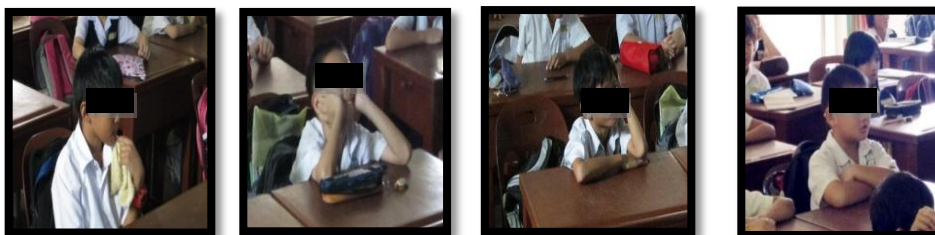
图表十二：四位研究对象专心上课的模样

观察数据表显示，“情境教学法”能激发学生上阅读课的兴趣。四位研究对象上课时非常专心地听课，也很积极地参与老师的每个教学活动。每当我发出提问时，这四位研究对象都很积极的举手要求要回答我的问题。这种种的举动证明了情境教学法成功地吸引了他们的注意力，让他们在上课时都专心上课，同时也激发了他们上阅读课的兴趣。以下图表显示了四位研究对象专心上课的模样。