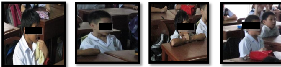
图七：四位研究对象上课时专心的模样

在使用情境教学进行阅读教学时，我委托同伴用相机拍下研究对象的情况。透过同伴所录的录像，我发觉四位研究对象上课时都表现出专心一致的模样。他们在老师的情境教学课时，个个都愉快地学习。另外，他们四个都踊跃地参与老师所准备的教学活动。每当老师发出提问时，这四位研究对象都积极地举手要求要回答老师所提出的问题。